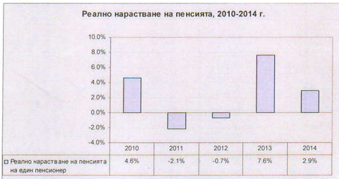
Фиг. 2 Реално изменение на средната пенсия, 2010-2014 г.

Средният размер на пенсията на един пенсионер през 2014 г. се предвижда да достигне 307,64 лв., при очакван среден размер за 2013 г. - 293,55 лв. Очаква се положителен реален ръст на пенсиите от 2,9 на сто през 2014 г. спрямо 2013 г., при прогнозирана стойност на средногодишната хармонизирана инфлация от 1,8 на сто за 2014 г.