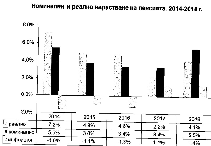
Фигура 1. Реално изменение на средната пенсия, 2014-2018 г.

Брутният коефициент на заместване на дохода за 2018 г. се очаква да бъде 41,6%, а нетният коефициент се очаква да бъде 53,6%.