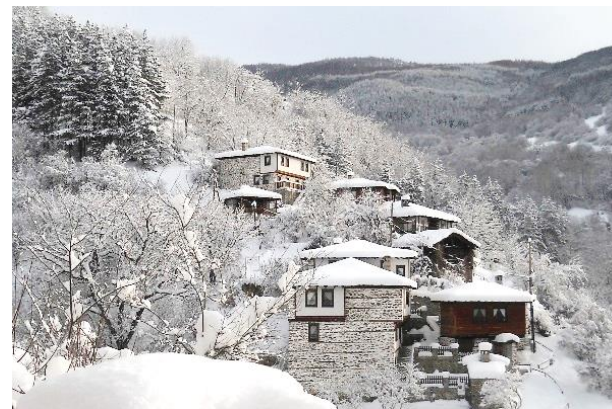
Културно наследство – комплекс „Косовските къщи“