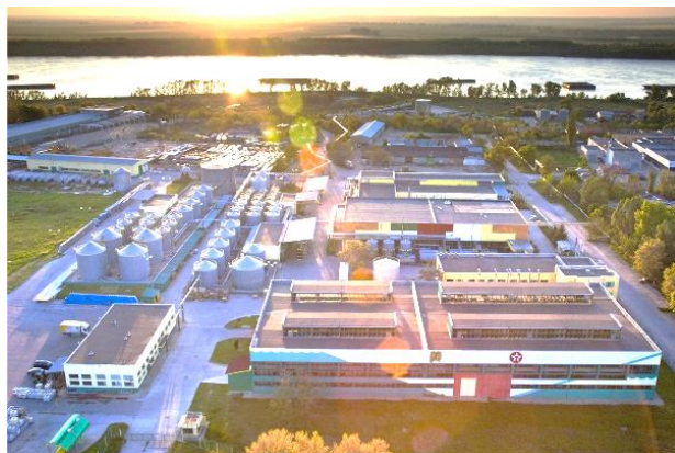
Холдинг „Приста Ойл“ – производител на моторни и индустриални масла