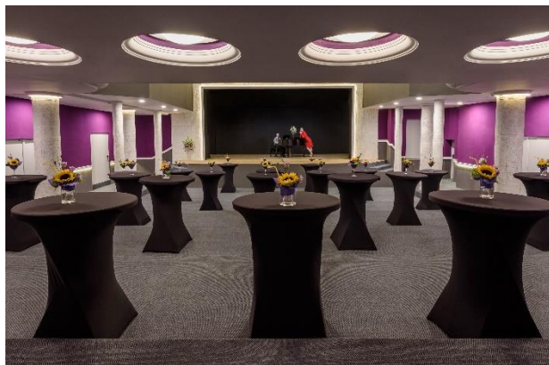
Арт център „Сити Марк“